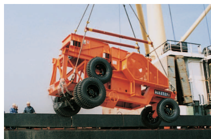
海外へ輸出される製品