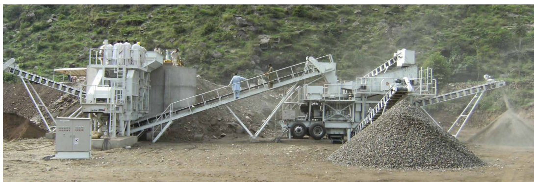
パキスタンでの稼働現場